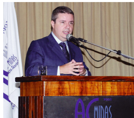
Antonio Augusto Anastasia participa de evento e fala dos avanços nas escolas de Minas

rede pública de ensino do Estado está em plena expansão. De um total de 4 mil escolas, cerca de mil não possuíam, até 2003, energia elétrica e 800 delas não contavam com abastecimento de água. “Os desafios físicos já estão sendo superados. A meta agora é garantir a melhoria do ensino”, afirmou Anastasia.