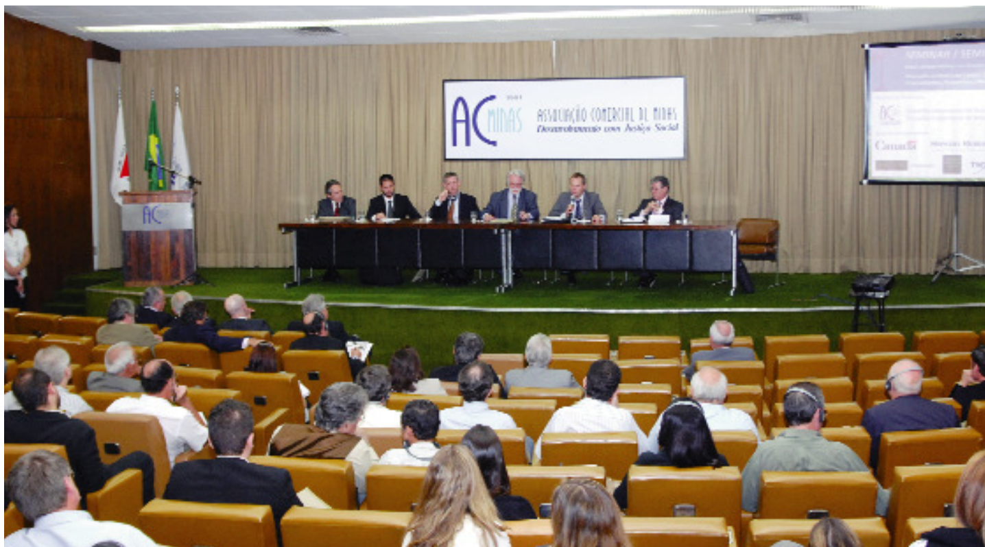
Empresários, especialista e autoridades do Brasil e Canadá participam de seminário na ACMinas

Seminário promovido pela ACMinas debate atração de investimentos para o setor com base na experiência canadense