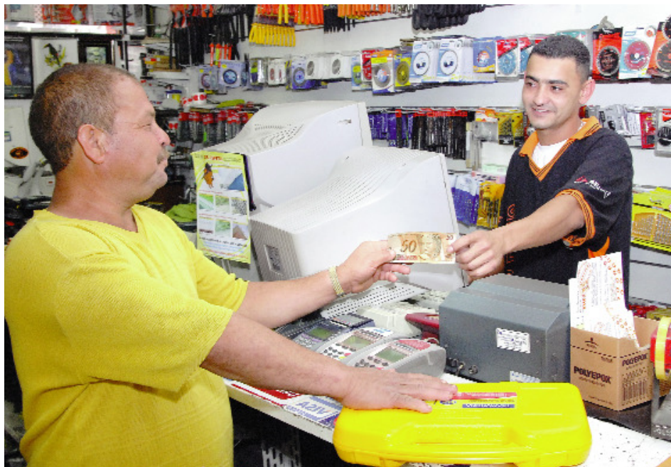
A diferenciação dos preços poderá pressionar administradoras de cartões a baixarem suas taxas

Medida Provisória encaminhada ao Congresso Nacional levantou uma polêmica antiga: os custos das operações com cartões. O texto, que previa a diferenciação de preço conforme a forma de pagamento, foi rejeitado pelos deputados no início de agosto, mas suscitou novo debate sobre a atuação das administradoras de cartões de crédito. “A AC Minas luta para tornar o mercado realmente competitivo. O que acontece hoje é um oligopólio com apenas duas empresas ditando as suas taxas, que