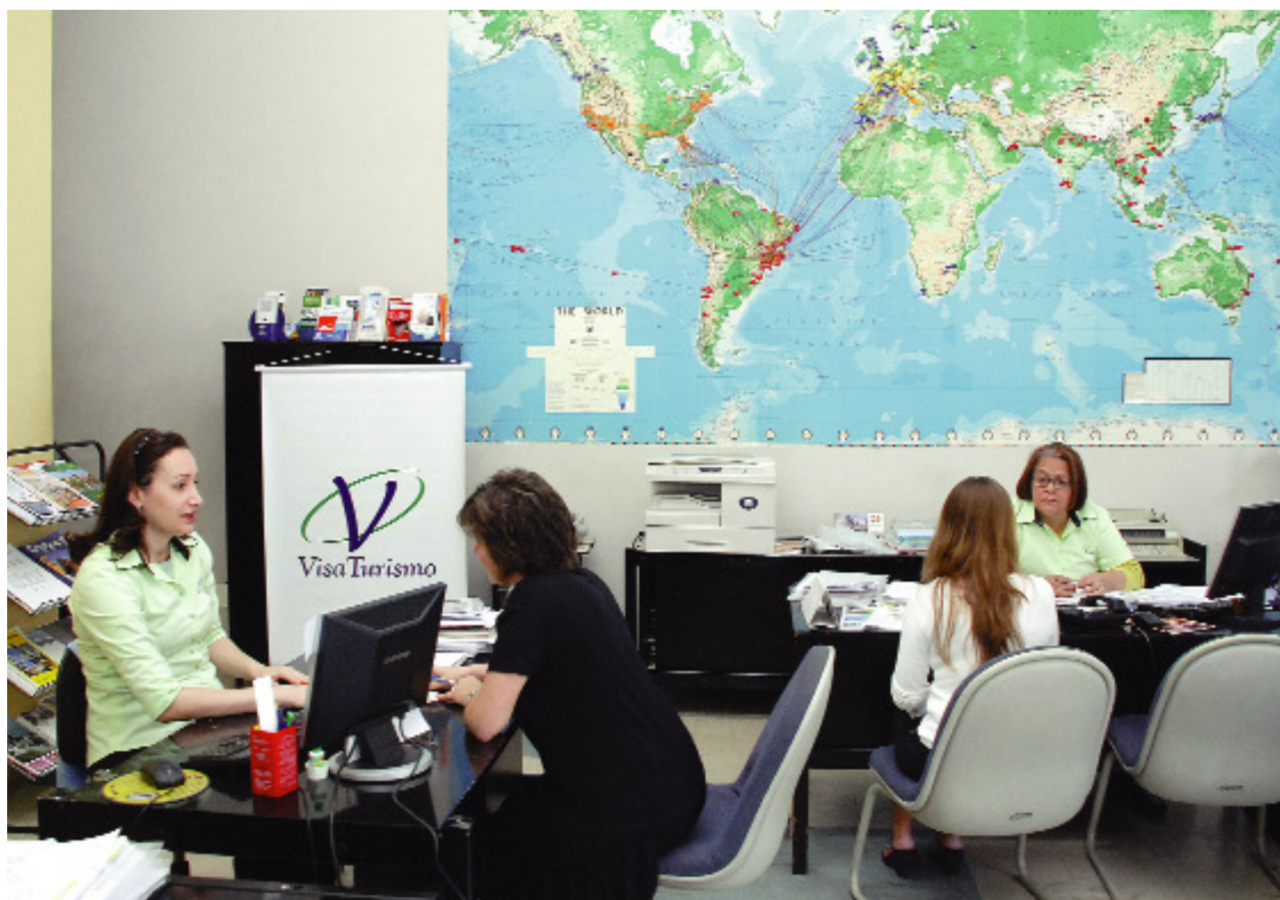
Medo da nova gripe fez com que clientes da Visa Turismo desistissem da viagem